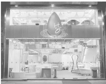
本集團新設之衛浴及廚具專門店「水之健」。

E. BON HOLDINGS LIMITED (Incorporated in the Cayman Islands)